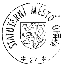
Ing. Zbyněk Stanjura primátor Statutárního města Opavy