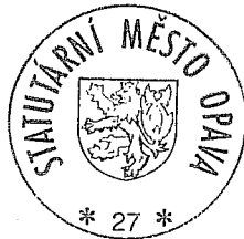
Ing. Zbyněk Stanjura, primátor Statutárního města Opavy