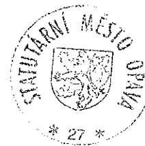
Ing. Zbyněk Stanjura primátor

Jezdecký klub Opava-Kateřinky Rolnická 120, 747 05 Opava 5 Tel./fax: 553 732 410 IČ: 68941749, DIČ: CZ68941749 ČJ Č. spoř. 030000-1842829389/03000