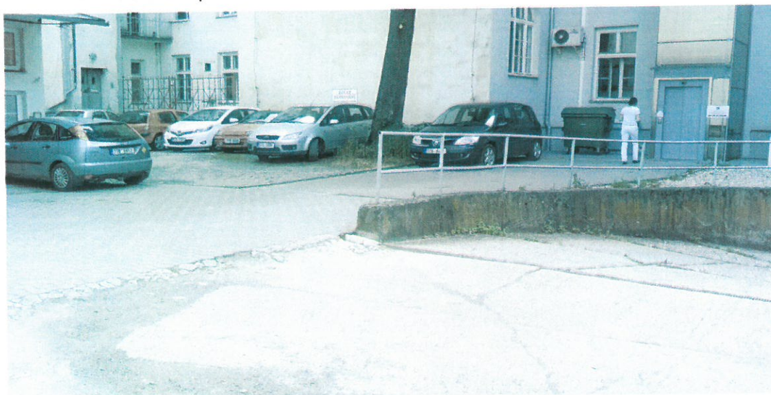
Přístup k p.č.395/1 s budovou č.p.310 -věcné břemeno