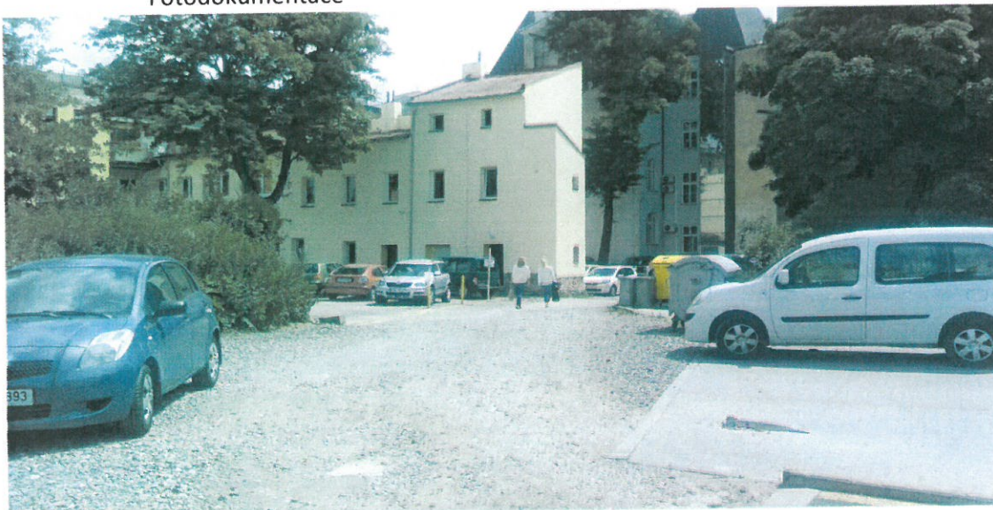
Přístupová komunikace k p.č. 392