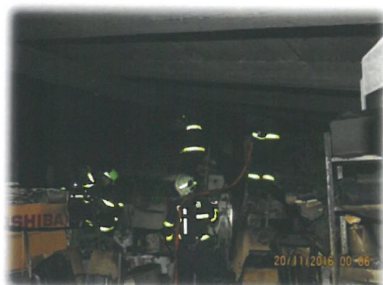
Záběry pořízené při vyšetřování požáru.