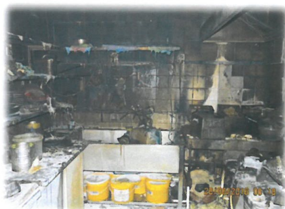
Záběry pořízené při vyšetřování požáru.