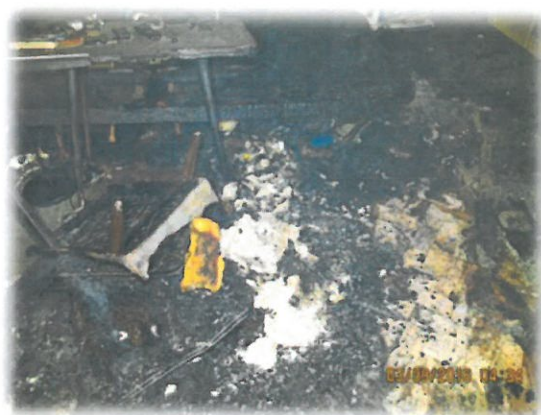
Záběry pořízené při vyšetřování požáru.

Datum: 19. 11. 2016 Adresa: Opava, náměstí Republiky