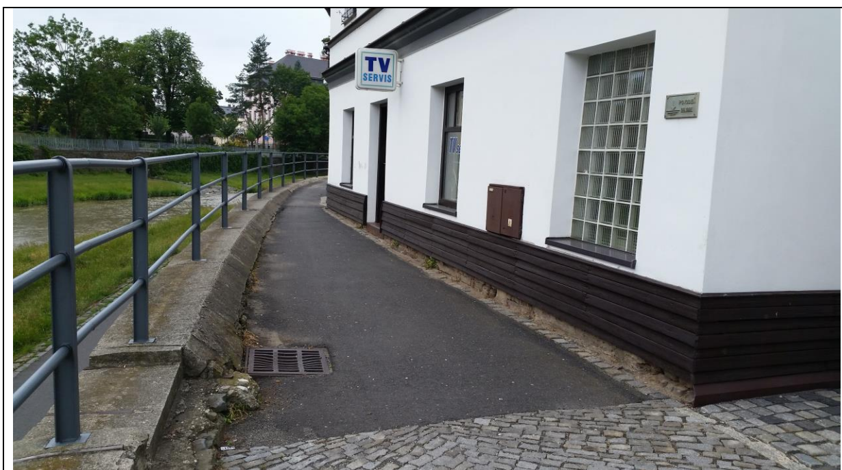
část parc.č. 2201/1