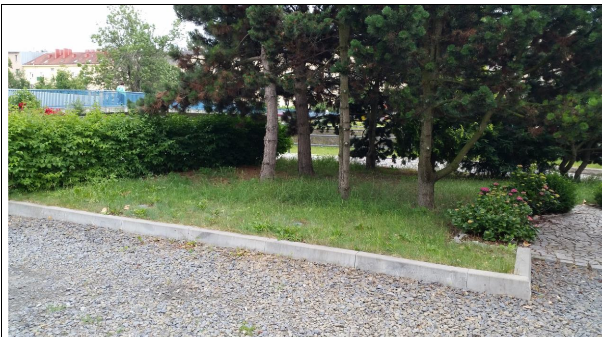
část parc.č. 2202