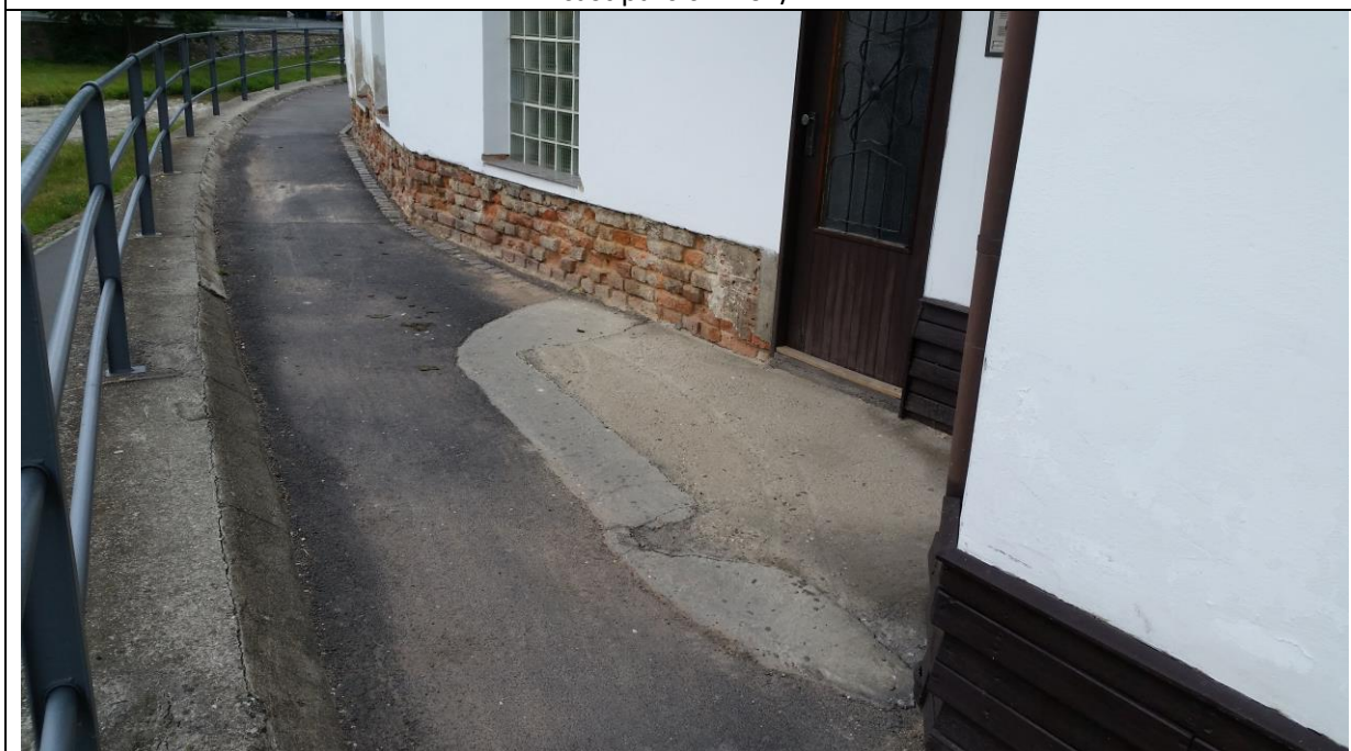
část parc.č. 2201/1