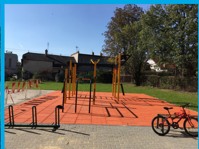
0.03 - WORKOUT HRŠTĚ