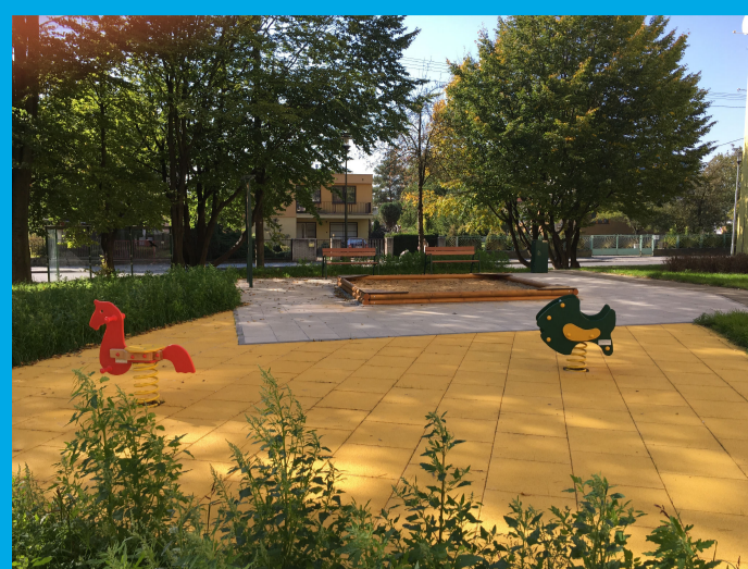
0.01 - DĚTSKÉ HRŠTĚ