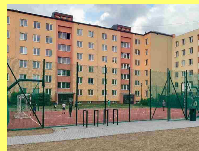
I.01 - MULTIFUNKČNÍ HRŠTĚ (SO 03)