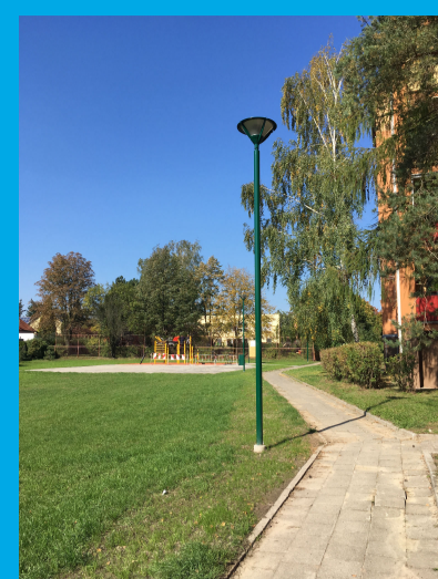
0.04 - VEŘEJNÉ OSVĚTLENÍ