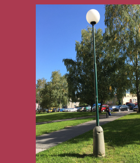
IV. 03 - OBNOVA A DOPLNĚNÍ VEŘEJNÉHO OSVĚTLENÍ