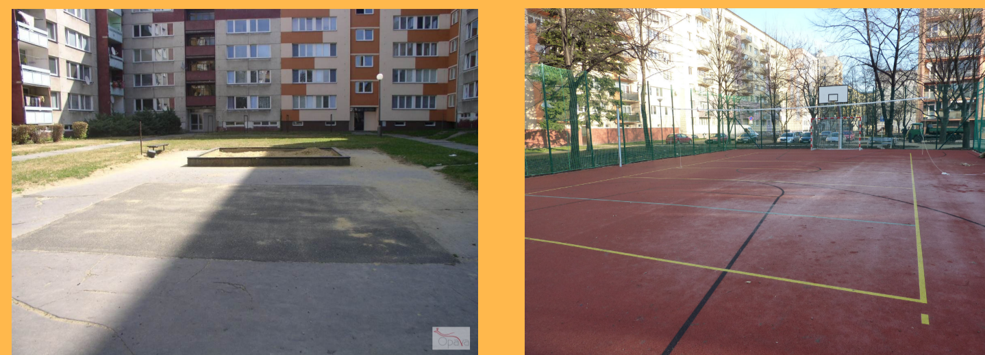
II. 03 - MULTIFUNKČNÍ HRŠTĚ