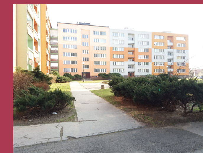
IV. 02 - REKONSTRUKCE PĚŠÍCH KOMUNIKACÍ A VOZOVEK