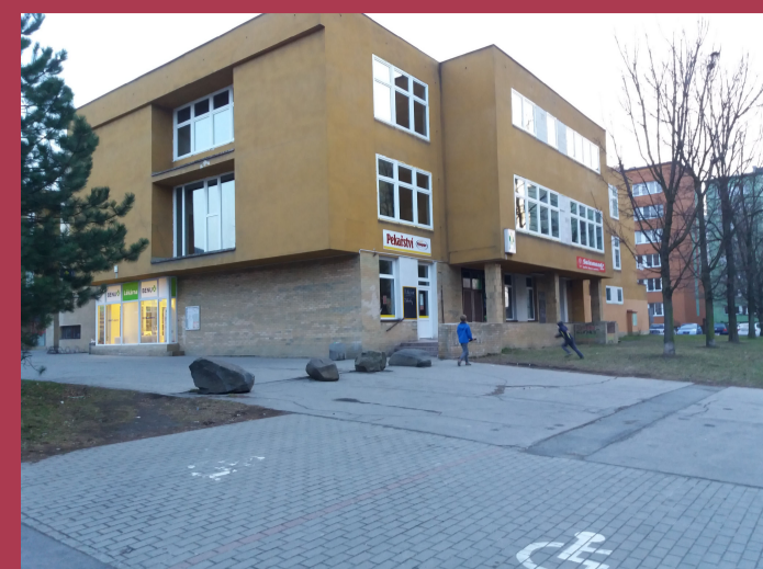
IV. 01 - VEŘEJNÉ PROSTRANSTVÍ PŘED OC ŽABKA