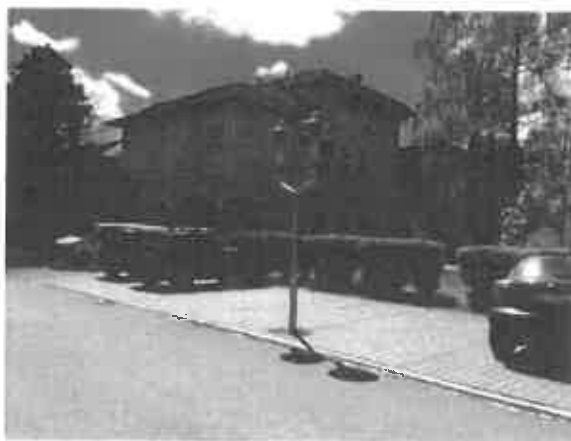
Svítlidlo VO v areálu nemocnice Opava