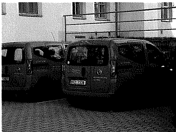
Vozidla pečovatelské služby Fiat Fiorino s úpravou CNG

V roce 2019 byla pečovatelská služba financována svým zřizovatelem, Statutárním městem Opavou, prostřednictvím provozní dotace s alokovanou částkou na pečovatelskou službu ve výši 1.327.000,- Kč.