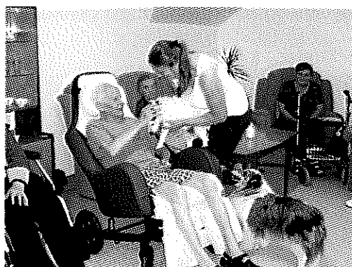
Canisterapie v rámci aktivizace klientů domova

V roce 2019 byl domov pro seniory financován svým zřizovatelem, Statutárním městem Opavou, prostřednictvím provozní dotace s alokovanou částkou na domov pro seniory ve výši 2.251.000,- Kč.