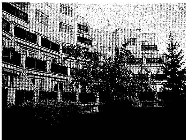
Vnitřní atrium s pohledem na terasy bytů Penzionu II