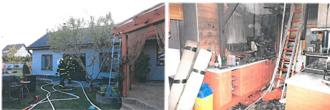
Záběry pořízené při vyšetřování požáru

Požár hospodářské budovy RD. Příčina vzniku požáru byla stanovena jako technická závada na elektrickém spotřebiči. Přímá škoda požáru byla stanovena vyšetřovatelem požárů na 200.000,- Kč. Uchráněné hodnoty hasebními zásahem byly 3.000.000,- Kč.