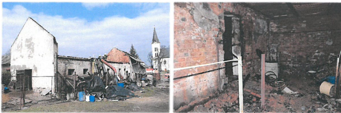
Záběry pořízené při vyšetřování požáru