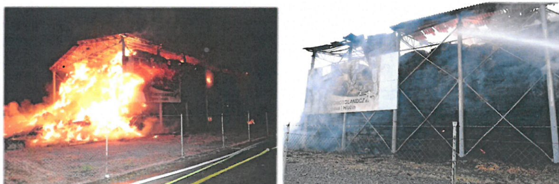
Záběry pořízené při vyšetřování požáru

Požár velkokapacitního seníku. Příčina vzniku požáru byla stanovena jako úmyslná manipulace s otevřeným ohněm. Přímá škoda požáru byla stanovena majitelem objektu na 987.000,- Kč. Uchráněné hodnoty hasebními zásahem byly 1.200.000,- Kč.