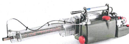
Desinfekční generátor SN50