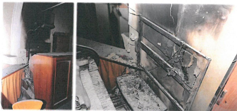
Záběry pořízené při vyšetřování požáru

Požár varhan v kostele. Příčina vzniku požáru byla stanovena formou verzí, a to nedbalost při provozu elektrického spotřebiče a technická závada – opotřebení konstrukce elektrického spotřebiče. Přímá škoda požáru byla stanovena majitelem objektu na 477.000,- Kč.