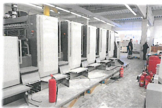
Záběry pořízené při vyšetřování požáru.