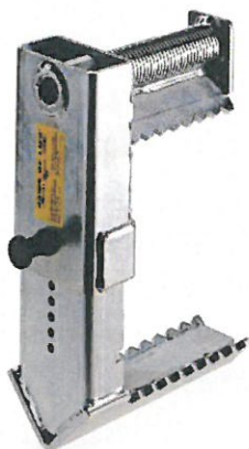
Prahová opěrka LUCAS