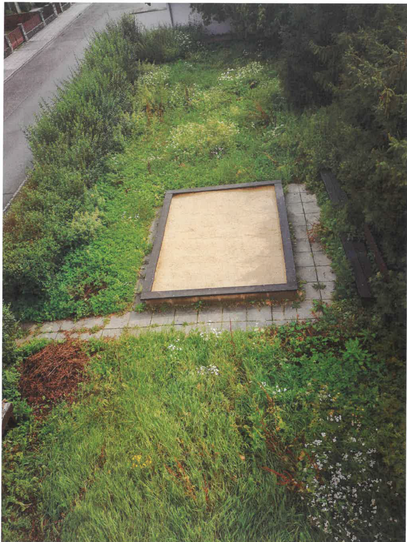
Příloha 1 – vysoká tráva, neudržovaná a zanedbaná zeleň, srpen 2020