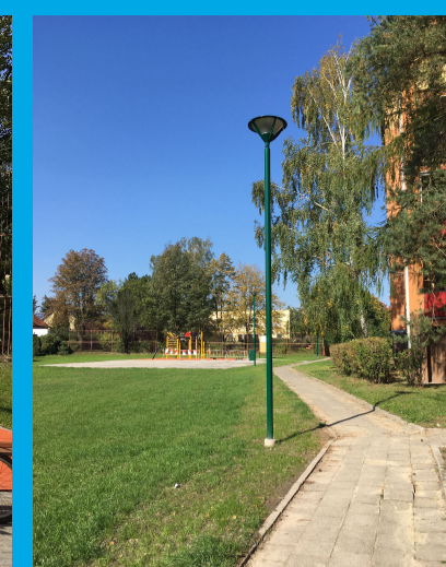
0.04 - VEŘEJNÉ OSVĚTLENÍ