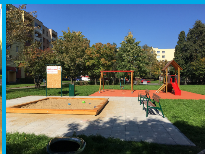
0.02 - DĚTSKÉ HRŠTĚ