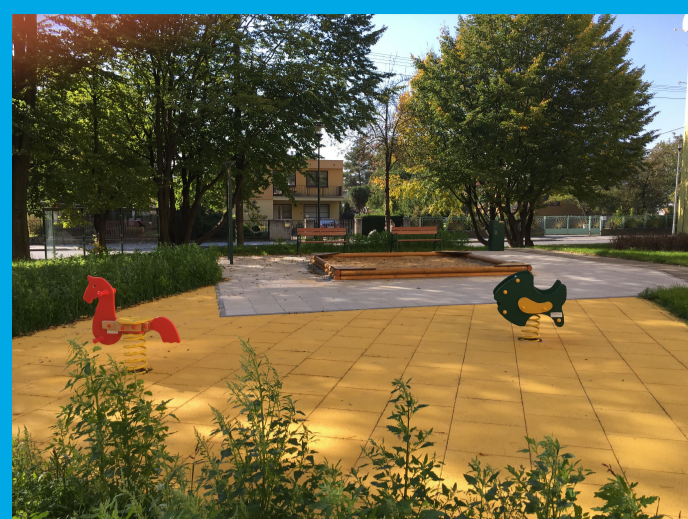
0.01 - DĚTSKÉ HRŠTĚ