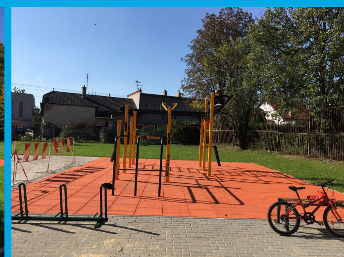
0.03 - WORKOUT HRŠTĚ