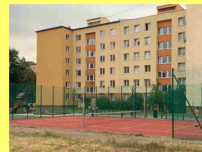
I.02 - MULTIFUNKČNÍ HRŠTĚ (SO 04)