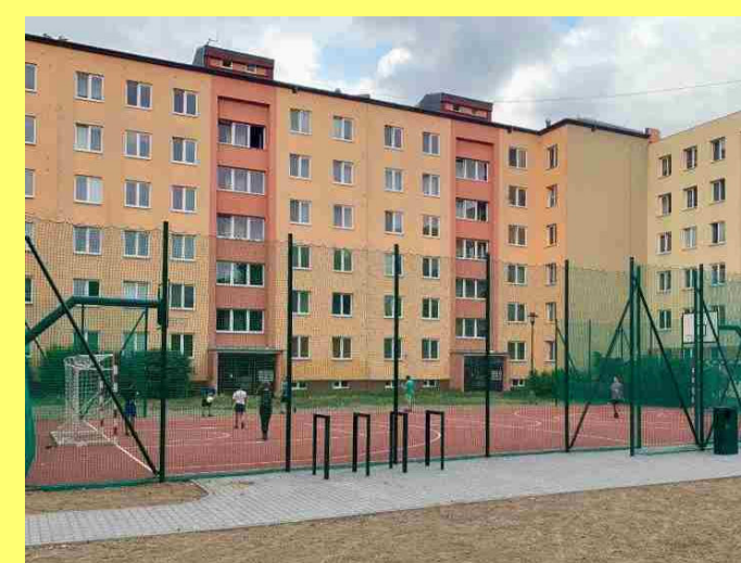
I.01 - MULTIFUNKČNÍ HRŠTĚ (SO 03)