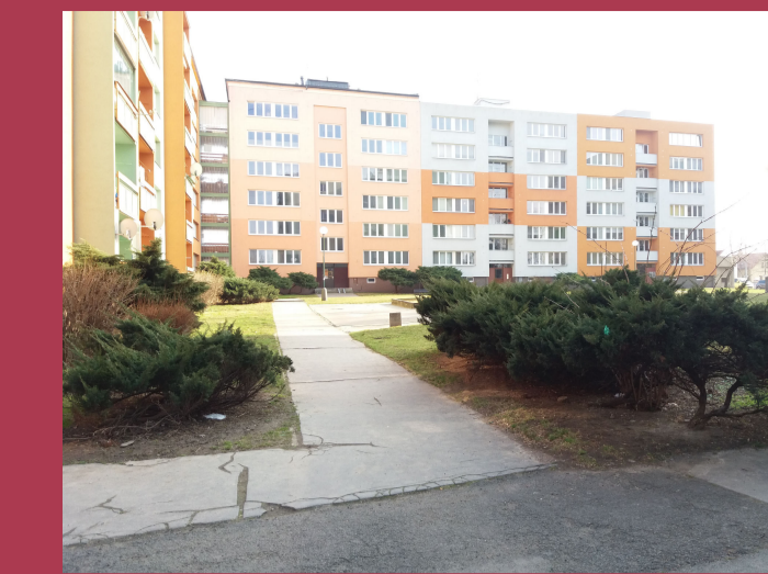
IV. 02 - REKONSTRUKCE PĚŠÍCH KOMUNIKACÍ, VOZOVEK A PARKOVACÍCH STÁNÍ