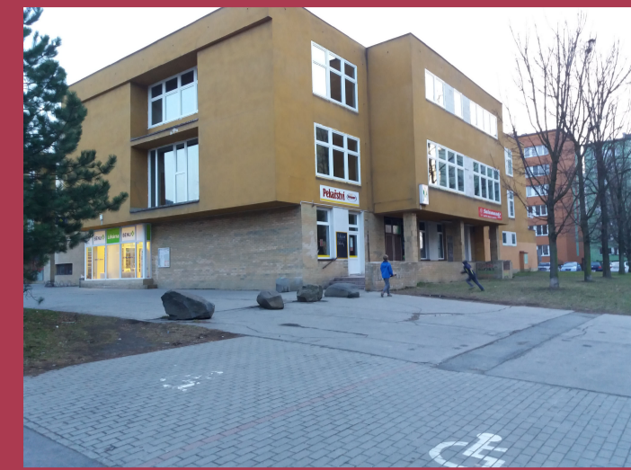
IV. 01 - VEŘEJNÉ PROSTRANSTVÍ PŘED OC ŽABKA