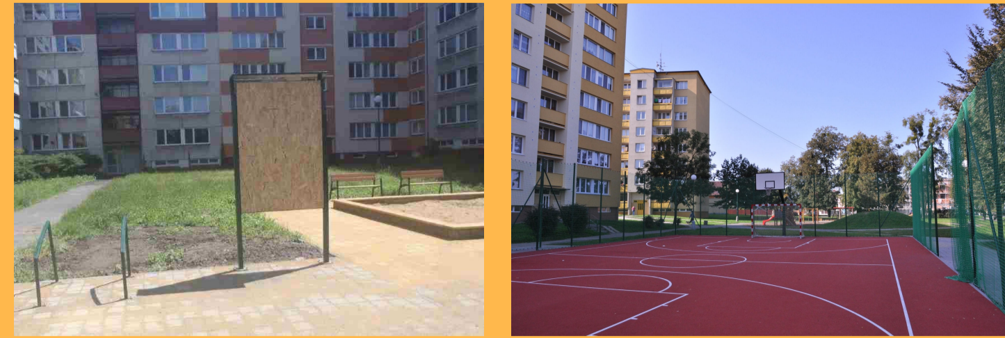
II. 03 - MULTIFUNKČNÍ HRŠTĚ