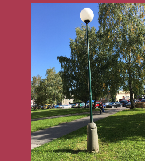
IV. 03 - OBNOVA A DOPLNĚNÍ VEŘEJNÉHO OSVĚTLENÍ