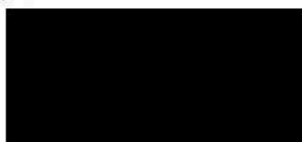
primátor města Opava