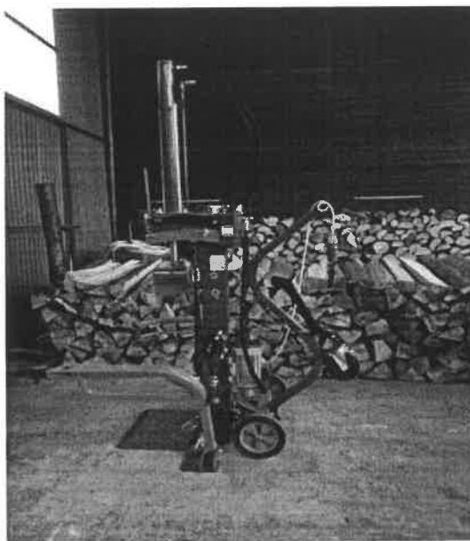
Štípací stroj Posch Hydrocombi 13