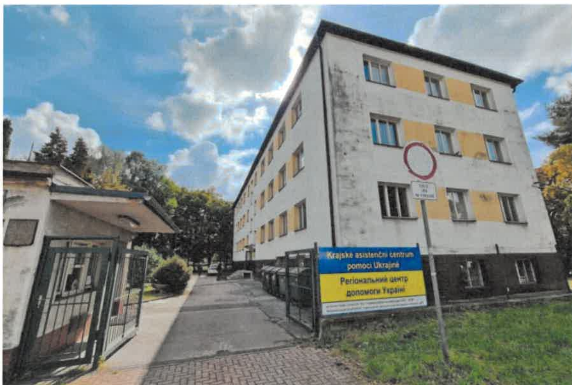
KACPU v Ostravě na ulici Dr. Malého 1356/17

Na provozu KACPU se v roce 2023 podílelo 61 příslušníků HZS MSK, kteří odpracovali více než 6000 hodin. Dočasná ochrana byla udělena 21 579 ukrajinským uprchlíkům. Nouzové ubytování bylo přiděleno 2 175 přechajícím osobám.