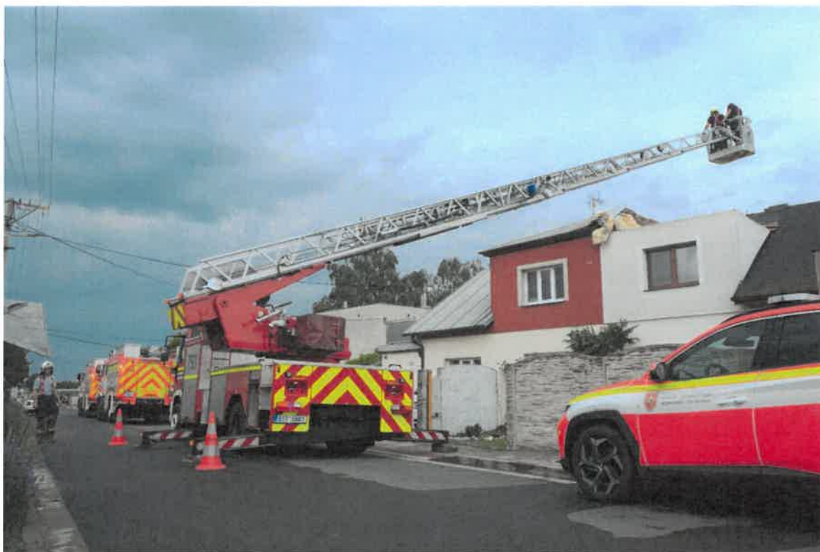
Zásah jednotky při větrné smršti v Otčích, červen 2023

Zde je nutno konstatovat, že všichni příslušníci HZS MSK se snaží v maximální míře vyhovět všem požadavkům směřovaným ze strany města ve všech oblastech vzájemné spolupráce. Zároveň si Vážíme podpory města a doufáme v trvalou a případně i zvyšující se finanční podporu pro náš sbor i v následujících letech. Tato podpora je pro nás významným zdrojem prostředků umožňujících realizovat investiční záměry.