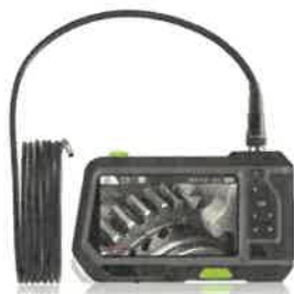
Endoskop s 5" IPS displejem, sonda 3,9mm, kabel 5 m TESLONG NTS500

Mezi další pořízené technické prostředky patří například: