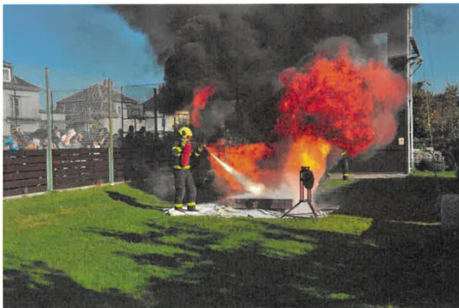
Ukázka z akce Den požární bezpečnosti

Příslušníci HZS MSK se aktivně účastnili akcí pro veřejnost, na kterých návštěvníkům přibližují zásady správného chování při mimořádných událostech a základy požární ochrany. Jednalo se například o akce: Den se složkami IZS Hlučín, Opavský dětský den, Ochrana člověka za mimořádných událostí, Festival povolání Opava a další.