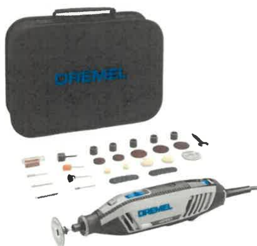
Multifunkční bruska DREMEL pro otevírání zámků