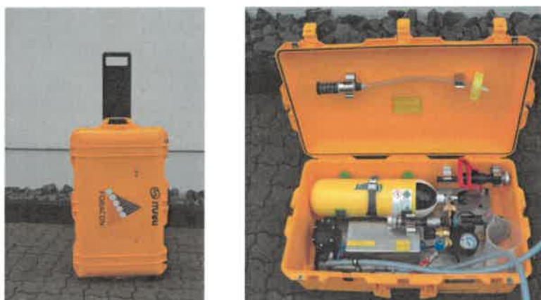
Souprava pro rychlou dekontaminaci Quick FOBACON