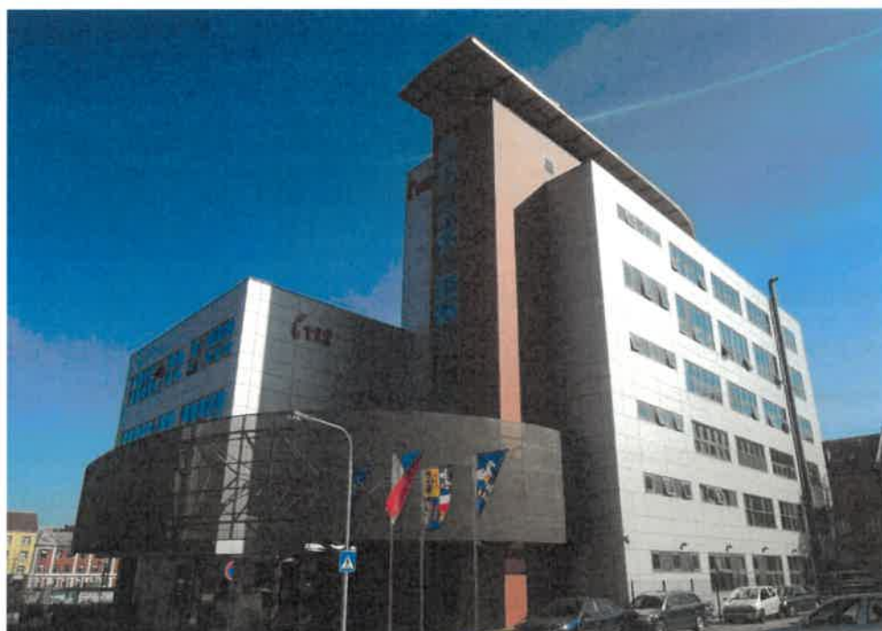
Integrované bezpečnostní centrum v Ostravě