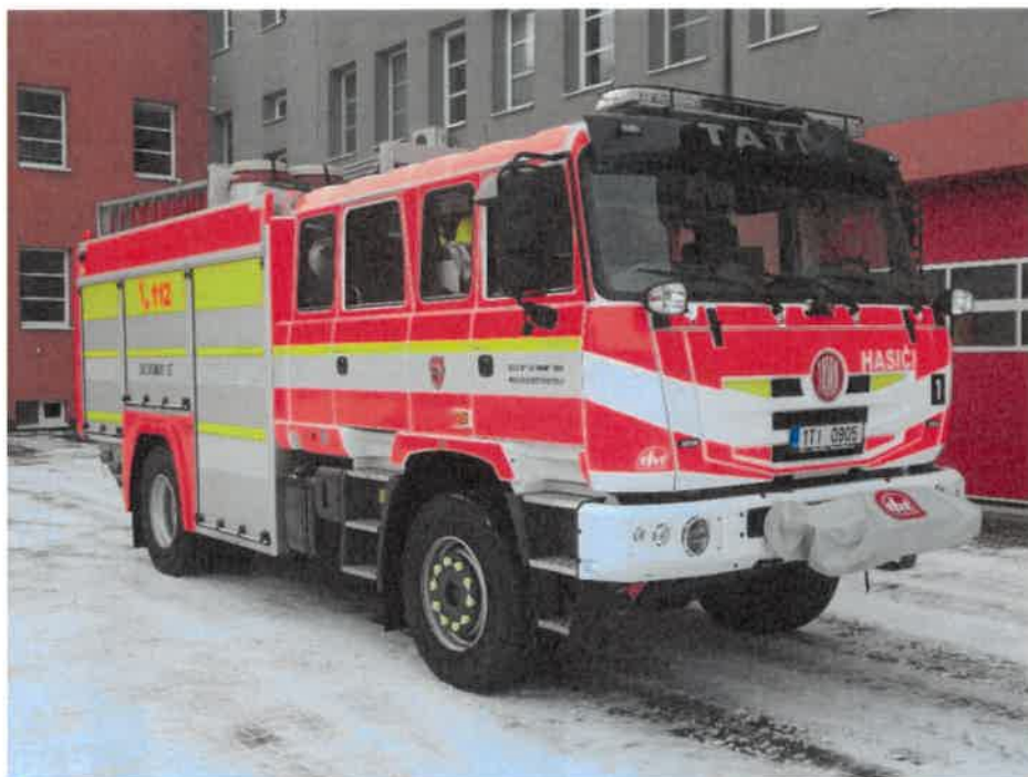
CAS 20/4000/240 S2T T815-2 4x4.2 na podvozku TATRA TERRA, r. v. 2022, výkon motoru 325 kW.

žebřík je určen pro záchranu osob z těžce přístupných míst, pro hasební práce a pro provádění technických zásahu (např. osvětlení místa zásahu, sledování místa zásahu z výšky, odstraňování převisů sněhu apod.)