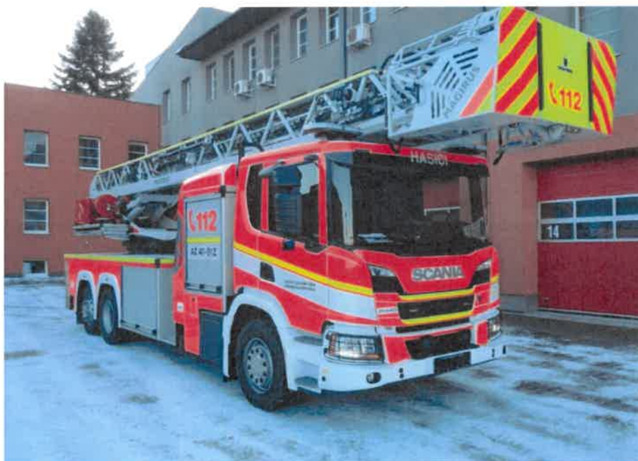
AŽ 40 SCANIA P450 B6X2/4NB – MAGIRUS M42L-AS, maximální pracovní dosah 42 metrů se zalamovacím ramenem, r. v. 2023, výkon motoru 324 kW.