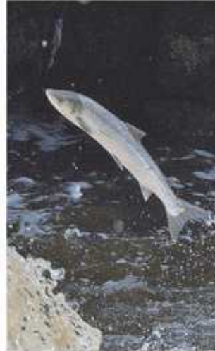
Najde losos cestu zpět? Ilustrační foto

Jestě na konci 19. století patřili lososi mezi nejčastěji lovené ryby. Například ve slavné kuchařce Magdaleny Dobromily Rettigové je uvedeno rovnou sedm receptů na lososí pochoutky. Tuto kdysi běžnou rybu si mohli dovolit i chudí. Dnes Povodí Odry dává loso-