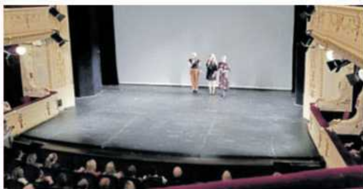
PŘEDPREMIÉRA v Opavě proběhla za účasti hlavní hrdinky.