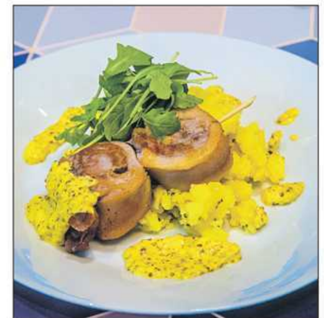
Staročeský špíz. Mezi oblíbená jídla Multifoodu patří česká klasika.

„Vaříme jen z čerstvých surovin a snažíme se minimalizovat každodenní produkci zby-